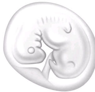
Figuur 1. Bij een normale zwangerschap wordt een vruchtzak aangemaakt met daarin een embryo

Is het zwangerschapsweefsel volledig uit de baarmoeder gedreven dan verdwijnt de pijn en het bloedverlies en sluit de baarmoedermond zich weer. Soms blijft er echter nog weefsel in de holte van de baarmoeder achter en is de miskraam (nog) niet compleet.